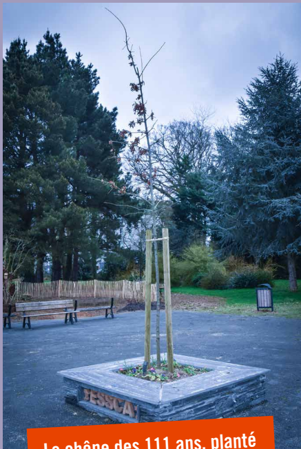
Le chêne des 111 ans, planté dans les jardins de l'ESSCA

À travers un programme d'événements essentiellement en ligne, l'ESSCA a profité de cette occasion pour rappeler les grandes étapes de son histoire et réaffirmer ses valeurs fondatrices, qui placent l'homme et l'éthique au centre de ses décisions et de ses actions. Elle a aussi évoqué l'avenir, en s'inspirant de son nouveau plan stratégique, Odyssée 20/24. Elle a surtout donné la parole à ceux qui la font vivre aujourd'hui, à savoir ses étudiants, ses diplômés et ses collaborateurs.