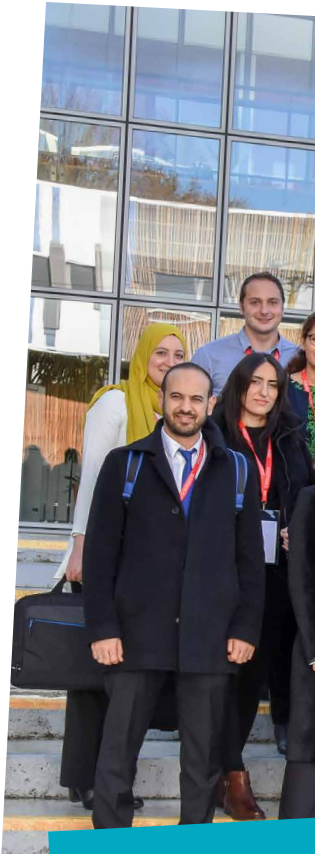
Rencontre PANORisk à Angers

Sur le plan de la pédagogie, après la création de son Institut de la pédagogie avancée il y a six ans, l'ESSCA a lancé en 2019 son Fonds d'innovation pédagogique pour soutenir les idées novatrices des professeurs en faveur de l'amélioration des méthodes d'enseignement. Concrètement, ce sont 25 000 € qui seront ainsi affectés cette année à la mise en œuvre des trois projets lauréats.