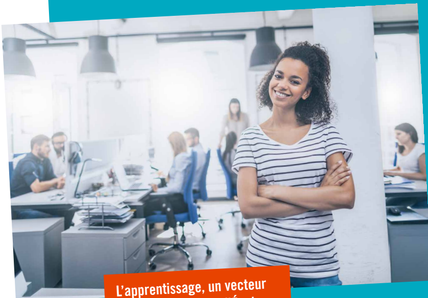
L'apprentissage, un vecteur de croissance pour l'École