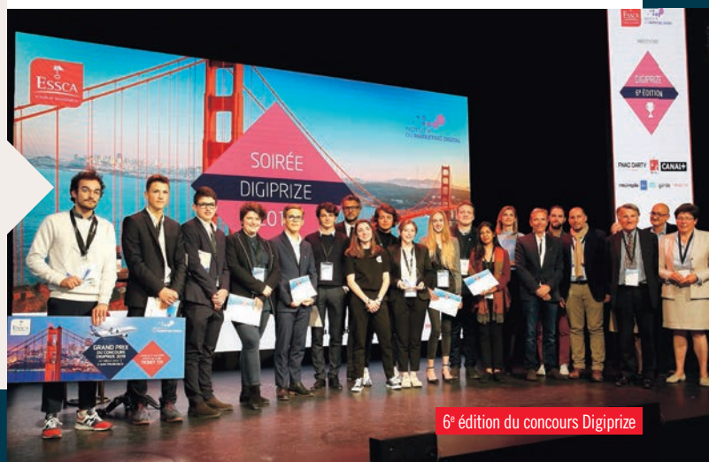
6 e édition du concours Digiprize