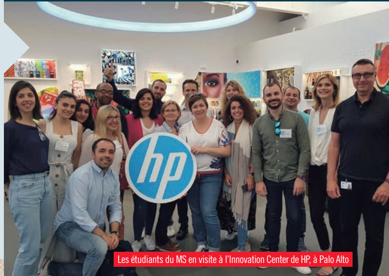
Les étudiants du MS en visite à l'Innovation Center de HP, à Palo Alto